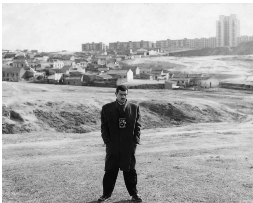
Ramón Masats

Ramón Masats nació en 1931 en Caldes de Montbui, Barcelona. Descubre la fotografía durante el servicio militar y da sus primeros pasos como aficionado en el Círculo Fotográfico del Casino de Tarrasa y en la Sociedad Fotográfica de Cataluña. Allí conoce a fotógrafos de la talla de Catalá Roca, Xavier Miserachs, Oriol Maspons y Ricard Terré, con los que expuso sus primeras fotografías. Mientras trabaja en el negocio familiar, decide fotografiar la fiesta de San Fermín para probarse como fotógrafo. Ante el buen resultado de la experiencia, decide trasladarse a Madrid en 1957 para trabajar como reportero en Gaceta Ilustrada, la mayor publicación gráfica del momento.