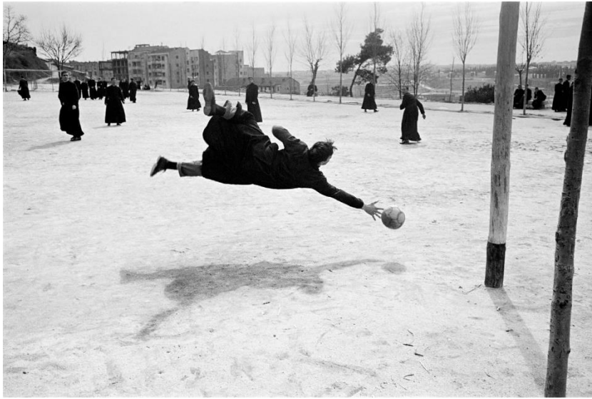
Seminario. Madrid, 1960

fotografía un papel relevante en el nuevo esquema profesional. Ramón Masats encontró allí su hueco como colaborador al llegar a Madrid.