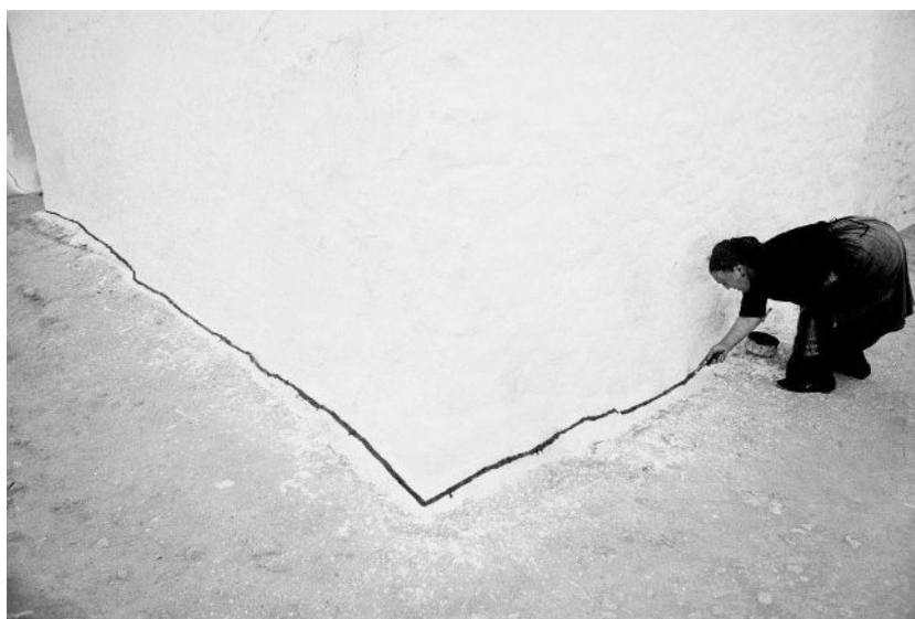
Tomelloso, Ciudad Real, 1960

Directo, simple y en inglés, la España autárquica de finales de los años cuarenta eligió este eslogan para publicitar nuestro país. Terminada la guerra en Europa, el régimen franquista intentaba posicionarse en el nuevo orden mundial y de paso conseguir ingresos para la exhausta economía. La posibilidad que ofrecía el inicio de la cultura del viaje y una oferta barata, iniciaron el proceso que convertiría al turismo en industria nacional una década después.