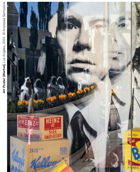
Art Poster (Wenthol), Los Angeles, 2022.